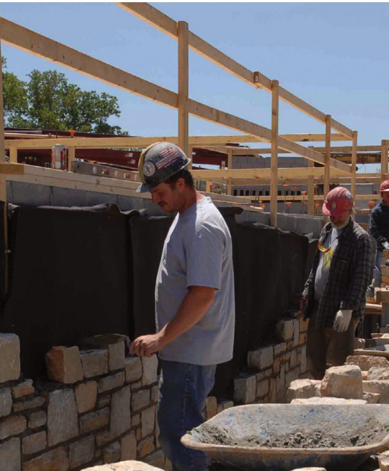
Centro Internacional de Capacitación del John J. Flynn BAC/IMI: Los Miembros Construyen el Futuro del BAC